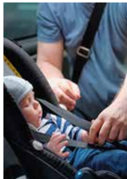
CADEIRINHA DE BEBÊ