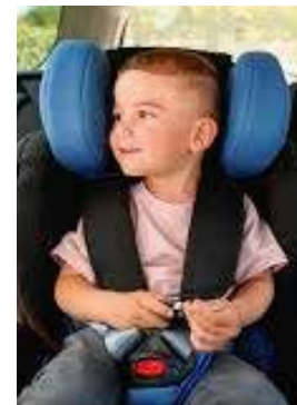
ASSENTO PARA CRIANÇA